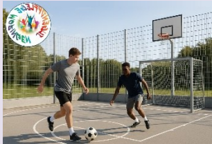
Mithilfe von KI erzeugt

Für die Anlage eines modernen Jugendplatzes erhält die Stadt Moringen 19.000 Euro LEADER-Förderung. Der Platz soll am Lustgartenweg, unweit der ehemaligen Tennishalle entstehen. Geplant ist ein multifunktionaler, umzäunter Kleinspielfeldplatz, der für Streetsoccer, Basketball und weitere Bewegungssportarten geeignet ist. Besonders bemerkenswert: Die Initiative geht direkt auf den städtischen Kinderrat zurück – ein Beispiel für gelebte Bürgerbeteiligung von klein auf. »Mehr